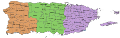
Regiones de CoCoRaHS de Puerto Rico Puerto Rico CoCoRaHS Regions